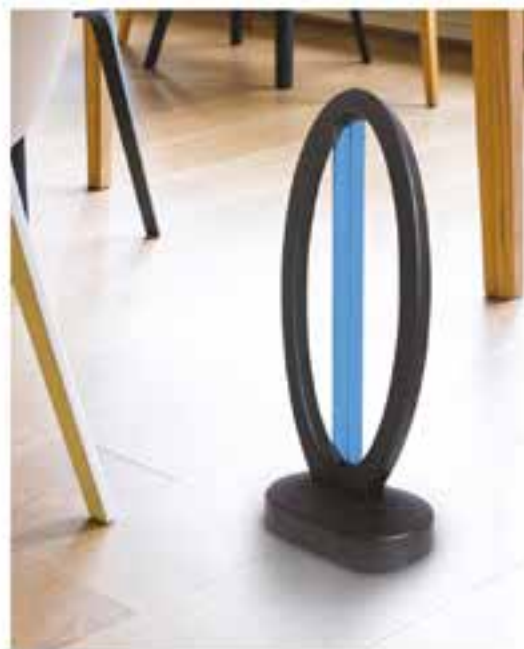
Lampada sterilizzante UV-C