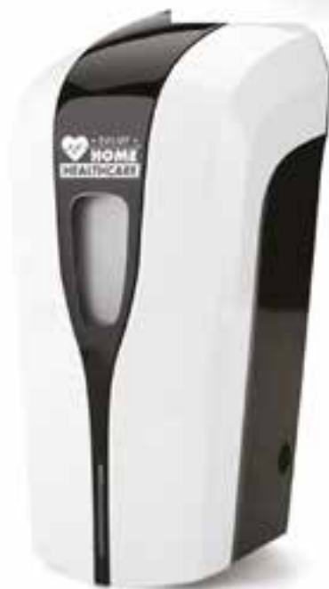
Distributore automatico gel disinfettante