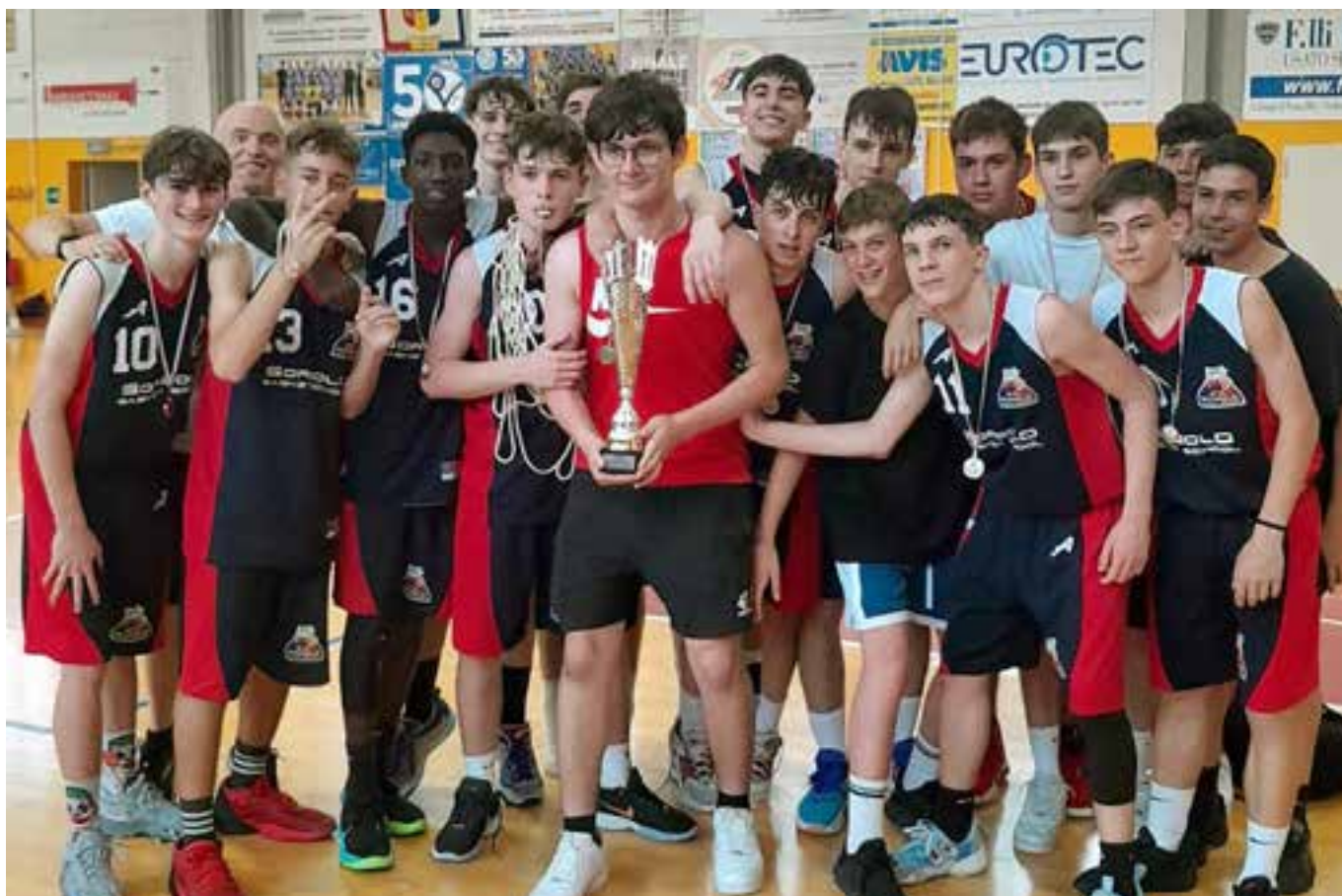
CAMPIONI UNDER 17 SILVER EMILIA ROMAGNA