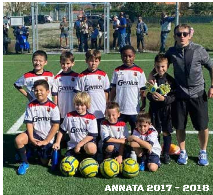
ANNATA 2017 - 2018